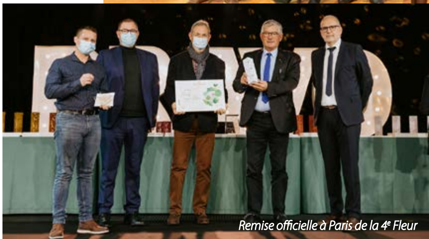
Remise officielle à Paris de la 4 e Fleur