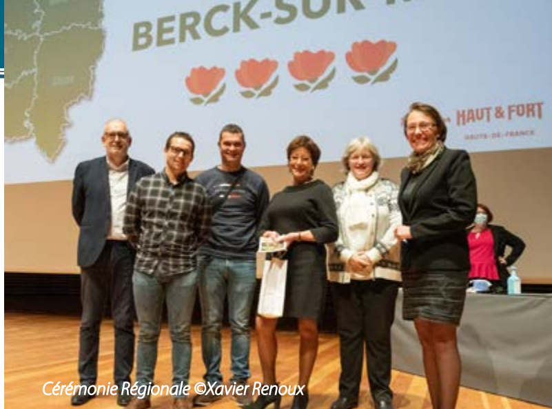
Cérémonie Régionale

C'est également la récompense de l'engagement de l'ensemble des agents de la ville qui œuvrent au quotidien, dans tous les domaines, pour faire de Berck-sur-Mer une ville agréable qui vit tout au long de l'année.