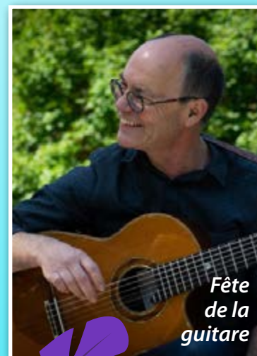
Fête de la guitare